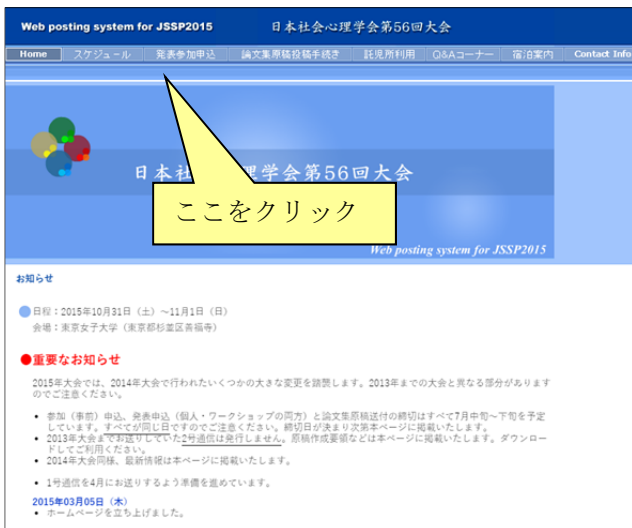
【大会 Web ページ】

続いて、エントリーページの発表参加申し込みに関する説明文の下方にある「参加申し込み」ボタンを押して下さい。