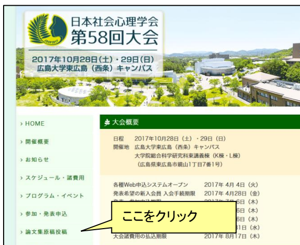
【大会 Web サイト】

大会 Web サイトにアクセスして、「論文集原稿投稿」をクリックしてください。エントリーページが開きますので、「投稿申込」ボタンをクリックしてください。